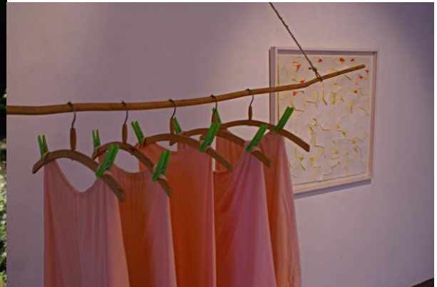
"Hot Pants", Konstbyken "Kokhett", Hagalunds Tvätterimuseum 2013 och samlingsutställningen "Islossning", Fullersta Bio Konsthall 2014.