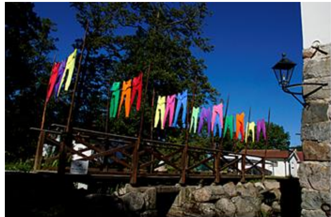
"Army of Lovers" Rånös slottspark 2018