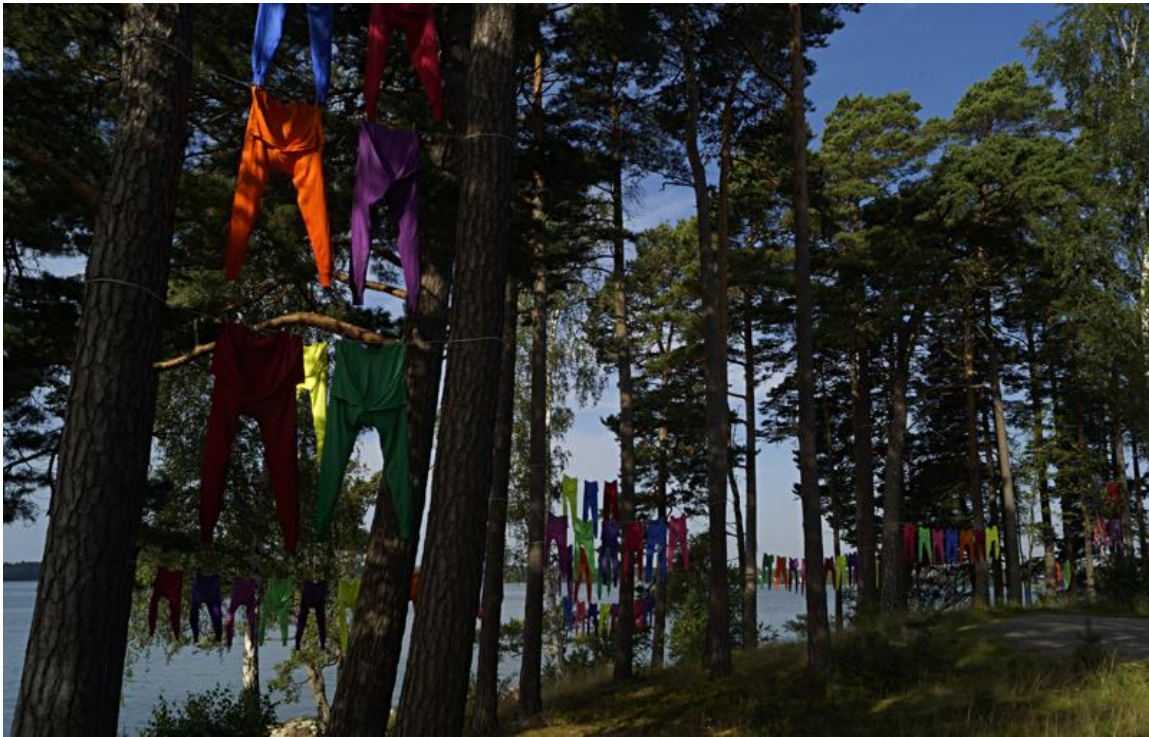
Hanaholmens Kulturcentrum för Sverige och Finland, Esbo, Helsingfors. Plats för "Army of Lovers" som Land Art installation hösten 2015, i samband med Svenska Skulptörförbundets 40-årsjubileum.