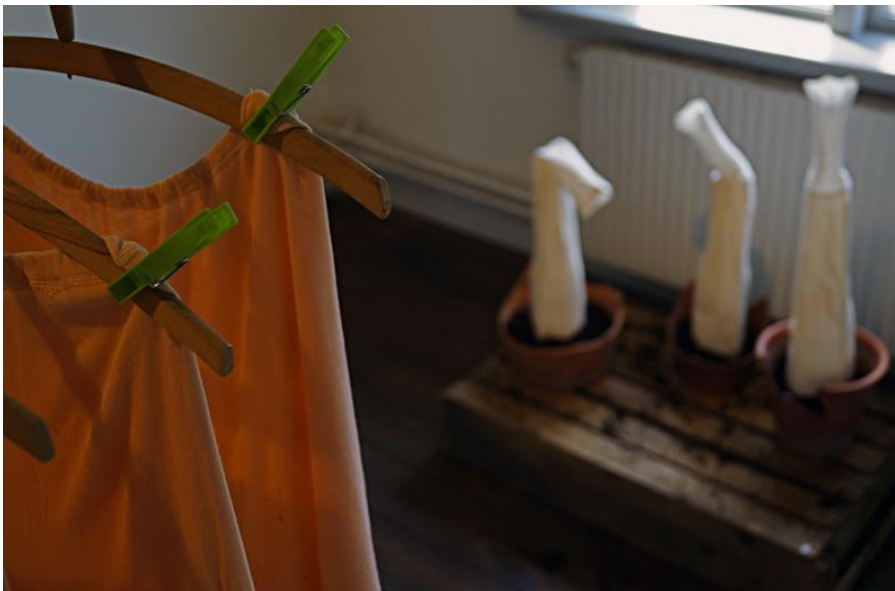
"Hot Pants" och "Höstprimörer", Olles utställning "Kompisar från förr", Gamla Rådhuset, Södertälje Konstförening 2014.