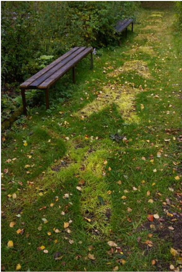
"Gångkläder" - efteråt!