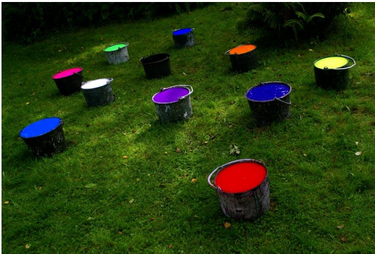
"Höstsådd", Konstbyken "Segslitet", Hagalunds Tvätterimuseum 2014.