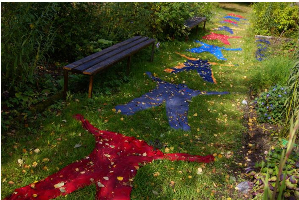
"Gångkläder", Konstbyken "Ostruket", Hagalunds Tvätterimuseum 2007.