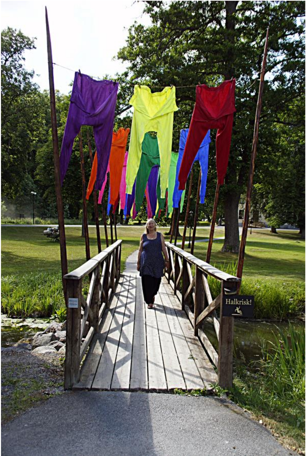
"Army of Lovers" Rånäs slottspark 2018