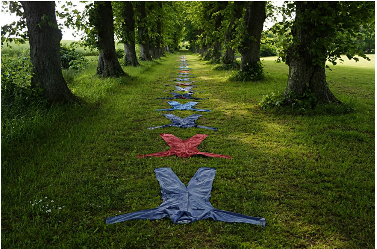
Marsvinsholms Skulpturpark, Skåne, sommaren 2015. Plats för "Gångkläder - overall/underall", i samband med Svenska Skulptörförbundets 40-årsjubileum.