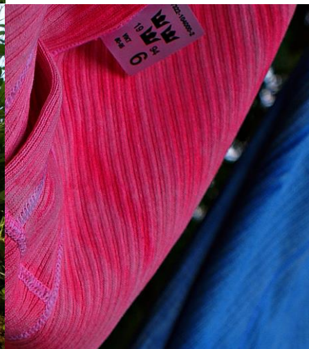
Konstbyken "Färgat" 2009 med "Spegel, spegel ..." Och kalsongbadet som blir "Army of Lovers", Konstbyken Glättat, Hagalunds Tvätterimuseum 2010.