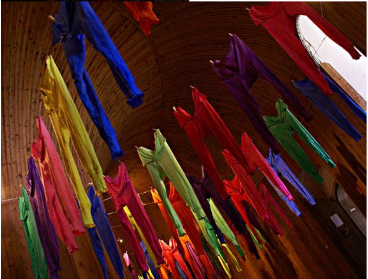
"Army of Lovers", Kruttornet, Vaxholms Fästnings Museum 2012. (100 par av Kronans begagnade och färgade långkalsonger i fredsmarsch runt Kruttornet)