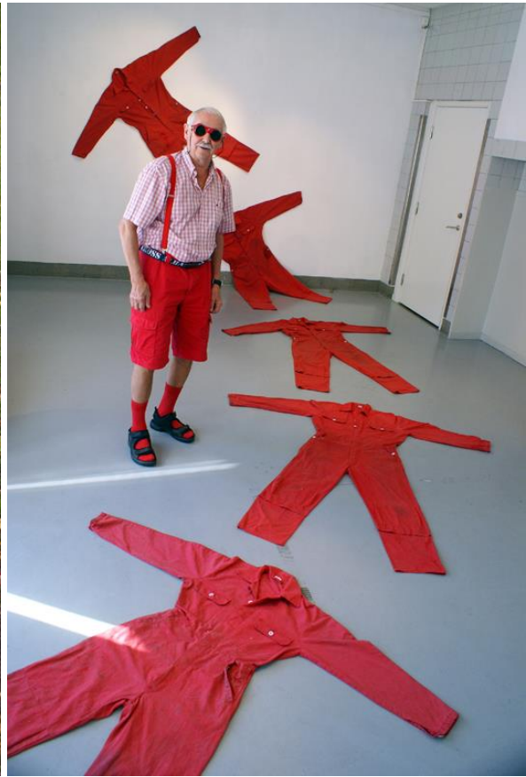
"Uppåt väggarna", Konstbyken i Konsthallen, + Svenerik Jakobsson, Fullersta Bio Konsthall 2013.