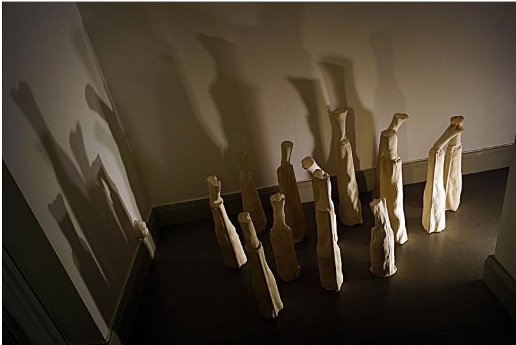
Ovan: "Torkvind" Utställning i Galleri HKK, Flygeln, Fullersta gård, Huddinge 2016