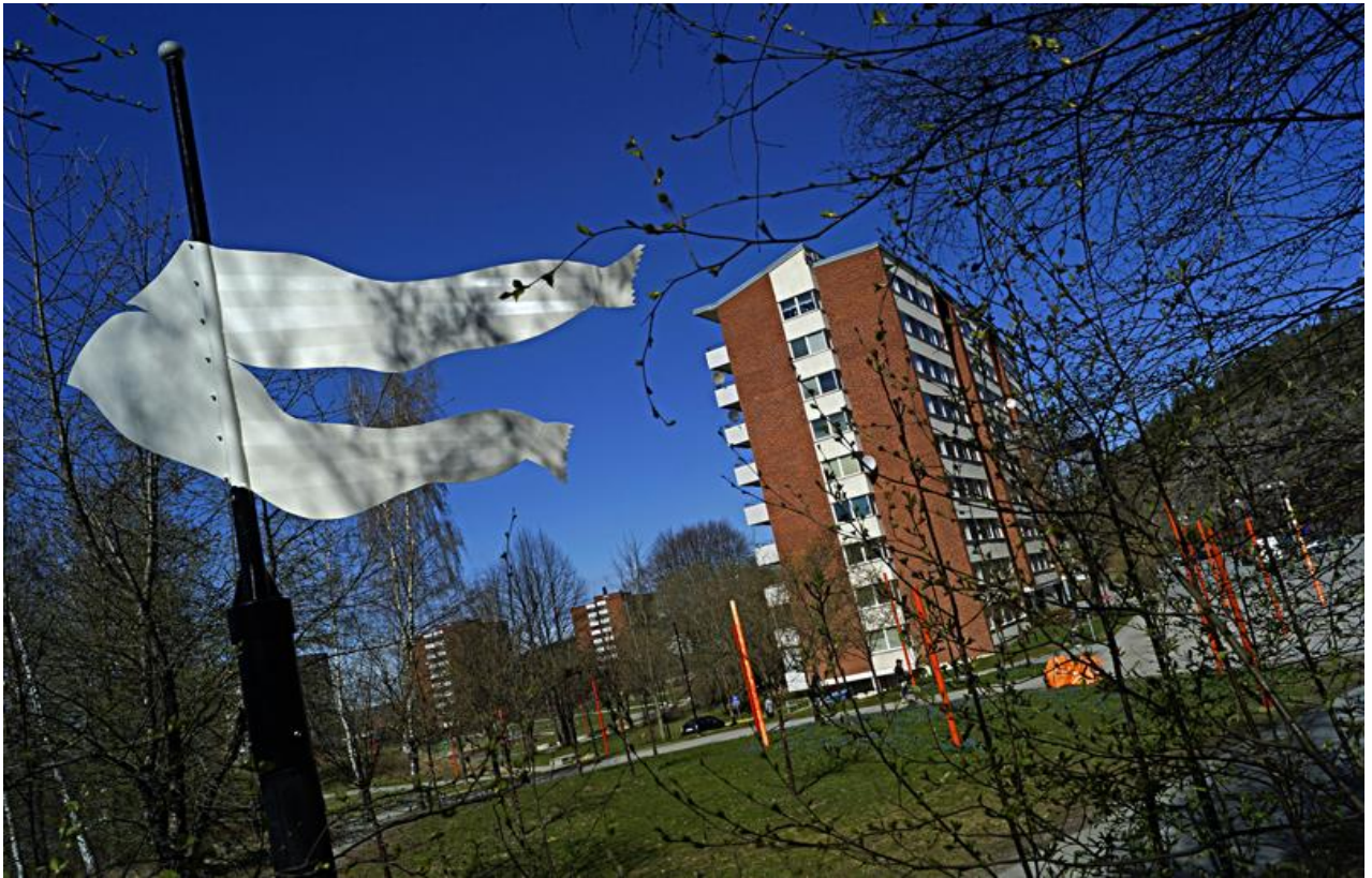
"Torkväder" Masmo Torg vid Masmo T-station. 3 stora vindflöjlar i plåt av tvätt; skjorta, lakan och långkalsonger, som konstverk och vägvisare till Hagalunds Tvätterimuseum. Montering på plats 25/4 2016